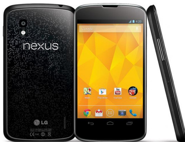
Google Play ikona na Android mobilnem telefonu